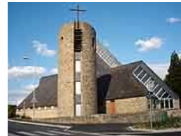
Paroisse Saint Guen Vannes

Merci de bien vouloir laisser cette feuille sur les tables au fond de l'église